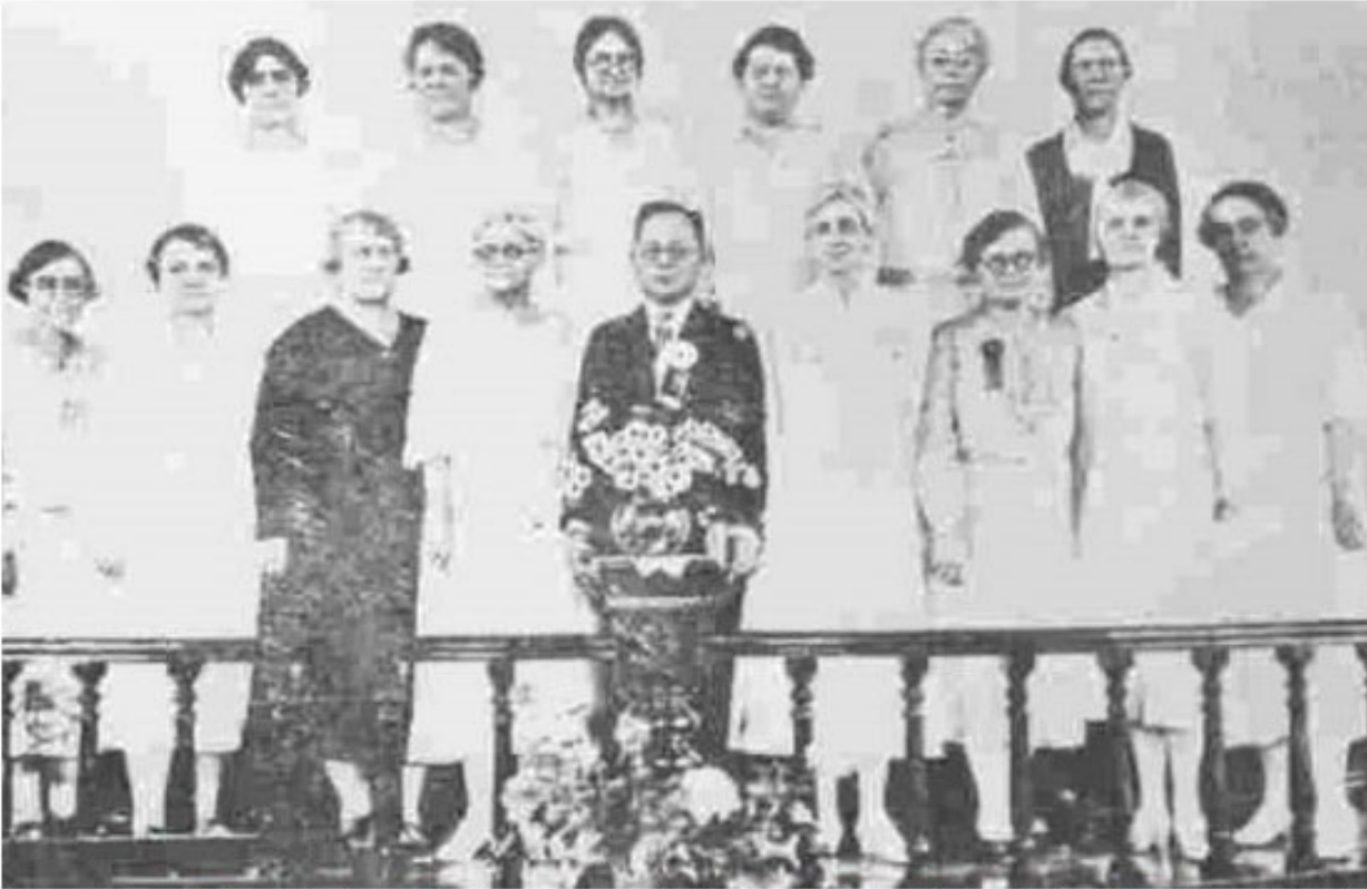
1930.6.4.정동교회에서 열린 조선감리회 제1회 연합연회에서 외국인 여자선교사 14명이 안수를 받았다.