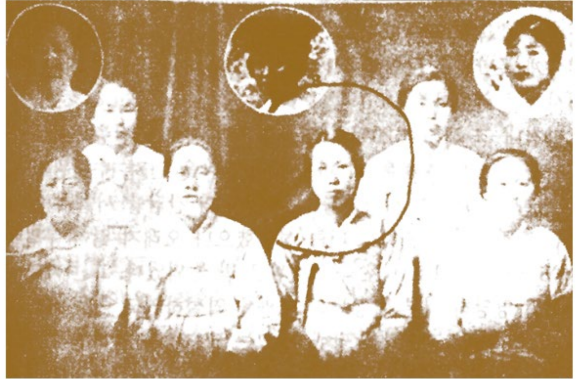
▲ 애국여성회는 여성들도 주체적인 독립운동가로 나선 일대 사건이었다.