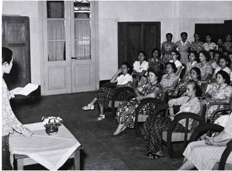
1953년 카르티니의 날 기념 Commemoration of Kartini Day in 1953