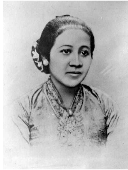
카르티니의 초상(1879~1904) Portrait of Raden Adjeng Kartini (1879-1904)

카르티니는 인도네시아 여성교육운동의 창시자로 원주민 인디언에 대한 여성의 권리를 개척한 선구자로 알려져 있다. 그녀는 중부 자바 자파라 출생으로, 1879년 4월 21일 귀족 집안에서 태어나 특권계급 출신에게만 입학이 허용된 네덜란드인 초급학교에 입학한다. 그녀는 이 학교에서 민족의식을 깨우쳤으며, 여성 교육의 필요성을 절감하였다. 그리하여 여성들을 위한 학교를 세워 인도네시아 여성들을 가르치는 데 앞장섰다. 선생은 여성의 평생 교육을 추구하고, 억압적인 법률과 전통으로부터의 여성 해방을 발전시킬 수 있는 권한을 가진 네덜란드 관리들과 정기적으로 대응했다.