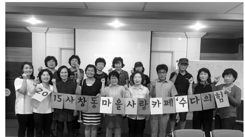
골목까지 안전한 마을 만들기 주민 만남

우선 학생들에게 성평등 기본교육을 실시했다. 1회 교육은 전교생 필수교육으로 진행하고 5, 6학년은 4차시 교육으로 성적 자기결정권에 대한 교육과 바바리맨 대면시 대응방법 등을 시뮬레이션했다. 교육 후 실질적인 작업은 공간의 주인공이 되는 것이다. 모르는 공간은 두렵다. 파악되지 않는 공간은 불안하다. 공간의 주인을 자기화하는 작업으로 공간 돌아보기와 픽토그램 ‘감시의 눈’ 디자인 벽