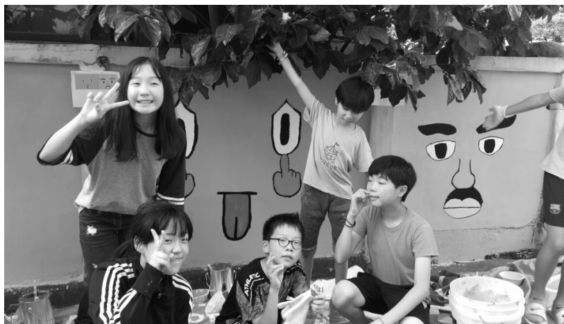
감시의 눈 디자인 벽화 만들기

‘근대는 마을을 버린 사람들에서 시작해서 마을을 만드는 사람들로 끝이 날 것’이라는 말이 있다. 마을은 공존하는 공간이다. 그래서 마을은 모두의 공간이어야 한다. 이웃아저씨와 이웃아주머니가 더 이상 낯설고 위협하지 않은 관계가 회복되는 곳, 빠르고 불안한 마음으로 지나쳐야 하는 골목길이 아니라 향유하고 누릴 수 있는 운치 있는 공간으로서의 골목길, 밤늦은 시간에 지친 몸으로 돌아와 눈뜨면 다시 빠져나가는 공간이 아니라 사람을 만나고 일을 모색하고 즐겁게 삶을 이어나가는 공간 말이다. 삶의 혈관과도 같은 마을의 회복, 공간의 회복이 필요하다.